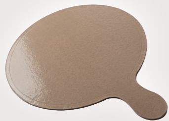
TAGLIERE CON MANICO