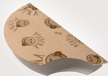
PORTA PIADINA E CRESCIONE