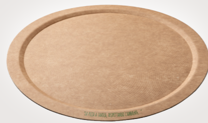
PIATTI PIZZA BIO